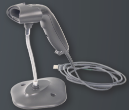
PRO BARCODE SCANNER